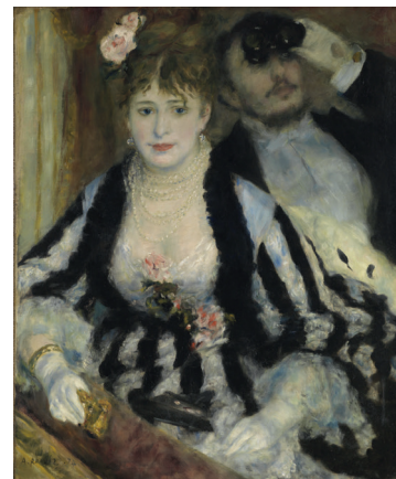
Pierre-Auguste Renoir La Loge, 1874 Huile sur toile