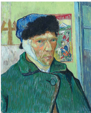
Vincent van Gogh Autoportrait à l'oreille bandée, 1889 Huile sur toile