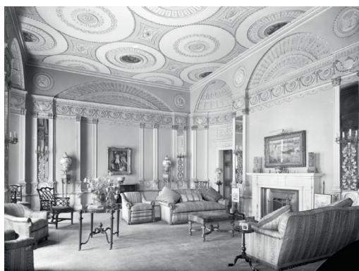
Home House - Music Room

Résidence de Samuel Courtauld de 1926 à 1932, Home House a abrité the Courtauld Institute of Art pendant plus de soixante-cinq ans. Anthony Blunt, célèbre historien d'art et conservateur des collections royales, en fut le directeur de 1947 à 1974.