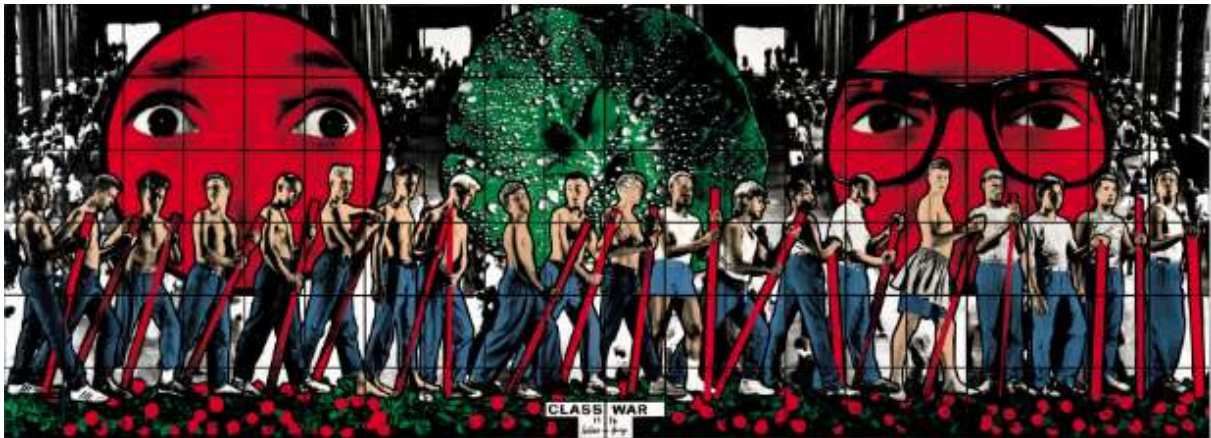
CLASS WAR FROM CLASS WAR, MILITANT, GATEWAY. 1986. 363 X 1010 CM

Gilbert (1943, Italie) & George (1942, Royaume-Uni)