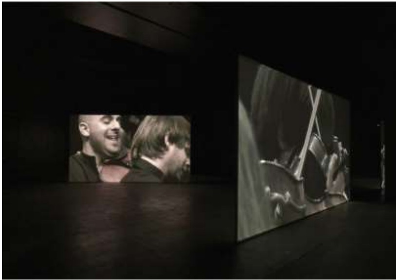
Douglas Gordon (1966, Royaume-Uni)