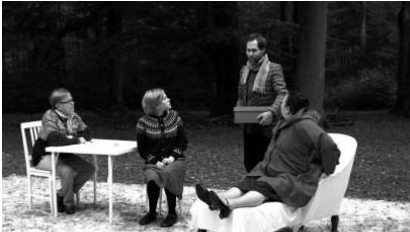
Ulla von Brandenburg (1974, Allemagne)