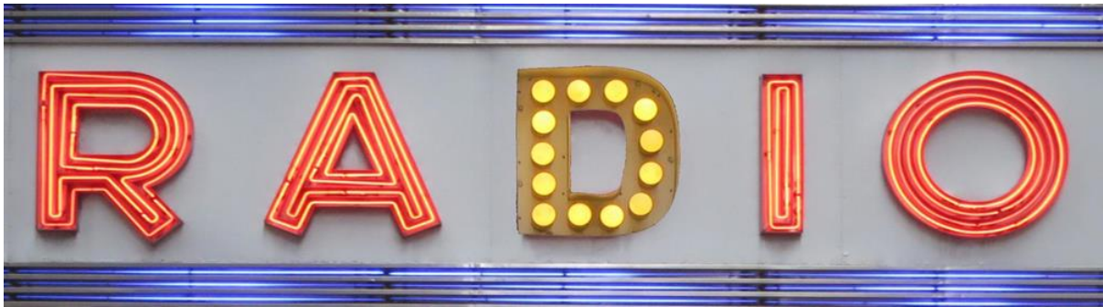
Photomontage © Anne-James Chaton

24h de création poétique contemporaine sous toutes ses formes, en public et en direct depuis la Fondation Louis Vuitton